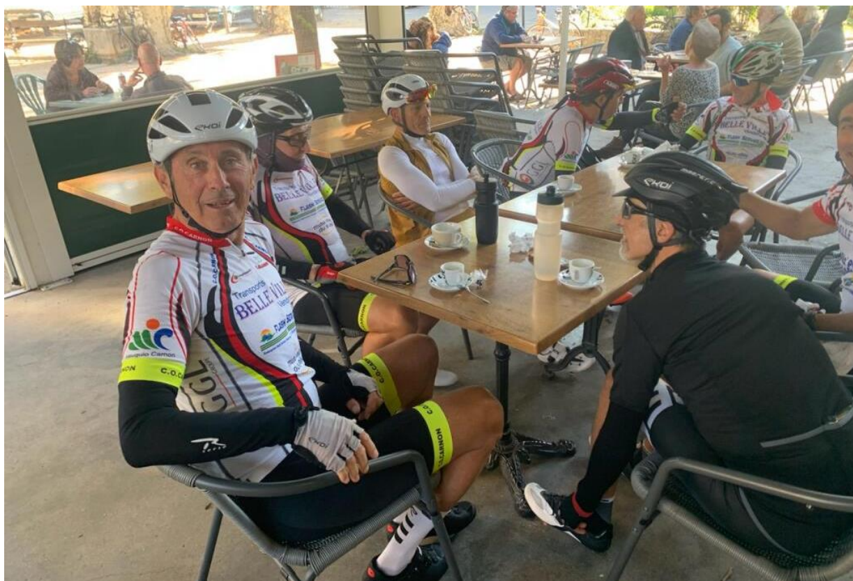
Le G1 au café à Lassalle, avec ci-dessous leur porte drapeau officiel